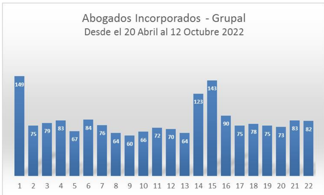
Grafico 1: Indicador estadístico con barras numéricas de abogados incorporados.

Sin embargo, sumando el total de abogados incorporados en el presente año desde el mes de Enero hasta la fecha, suman un TOTAL de 2,835 Abogados.